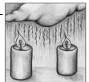
Zweiter Advent O Gott, ein' Tau vom Himmel gieß