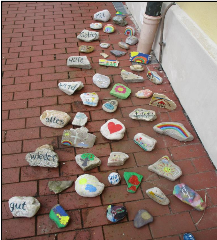
„Hoffungssteine“ der Kinder vor der Kirche in Einmuß