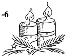
2. Advent: Die Erwartung wecken