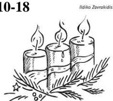
3. Advent: Der Verheißung trauen